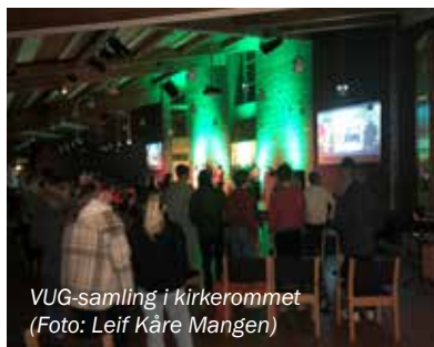
VUG-samling i kirkerommet