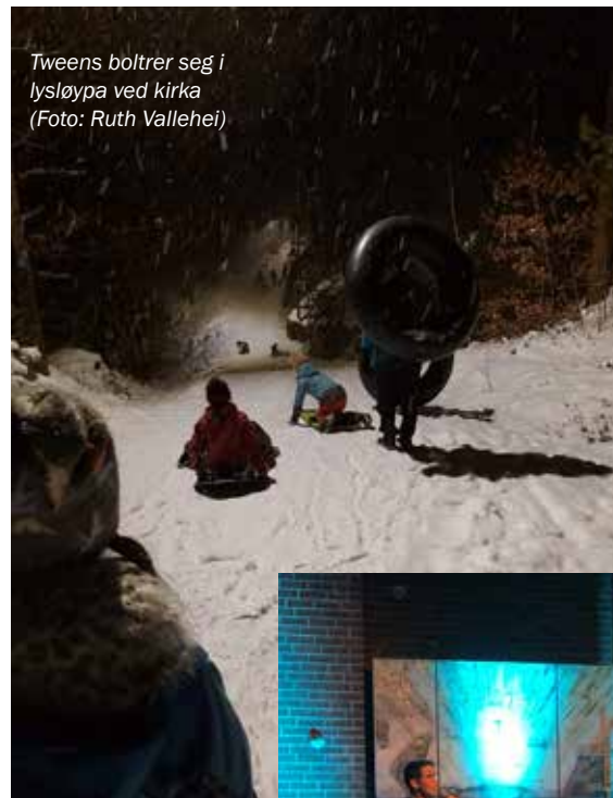
Tweens bolttrer seg i lysløypa ved kirka

Og sist, men ikke minst; på fredager har det kommet mange barn og unge som har skapt mye liv og god stemning både på Tweens (klubb for 5. - 7. klasse) og VUG (Voie UngdomsGruppe). Vi gleder oss over alle som kommer!