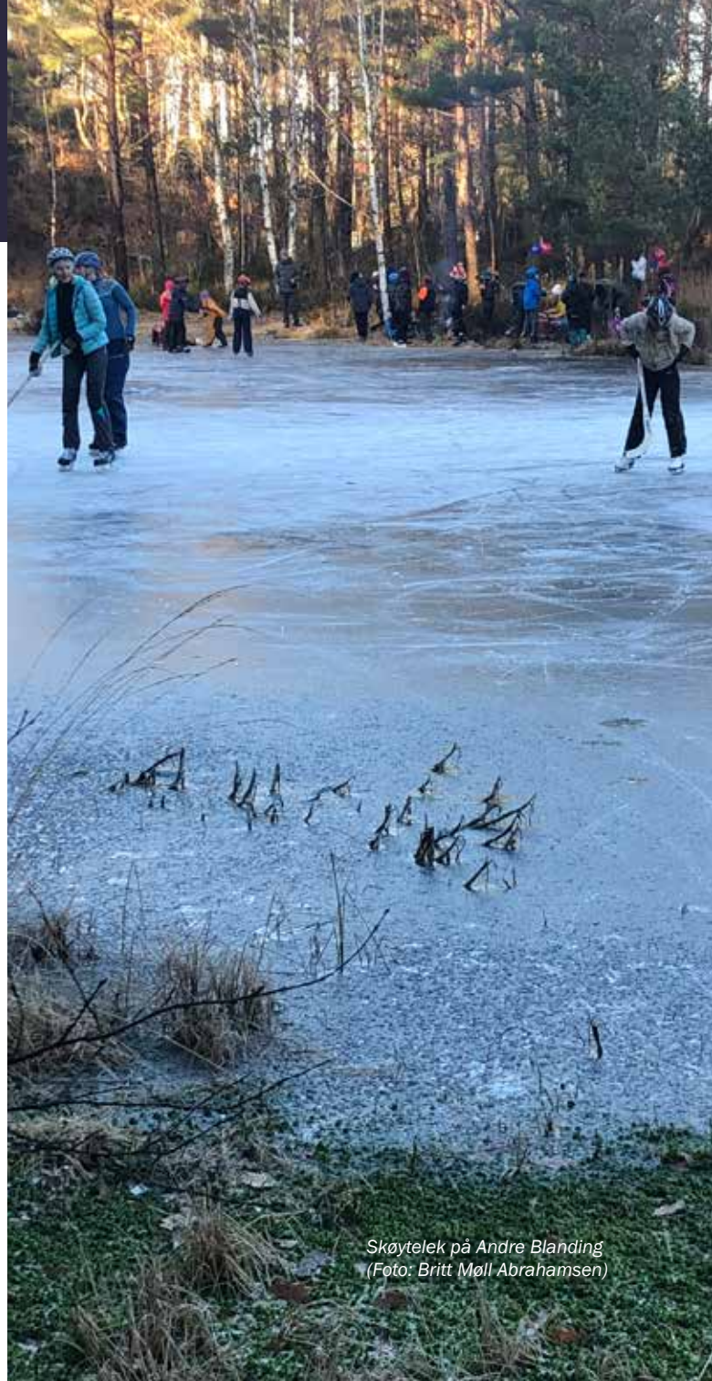
Skøytelek på Andre Blanding

Vi ønsker alle en fin tid fram mot påske.