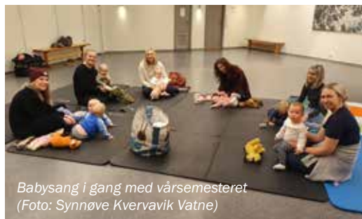
Babysang i gang med vårsemesteret