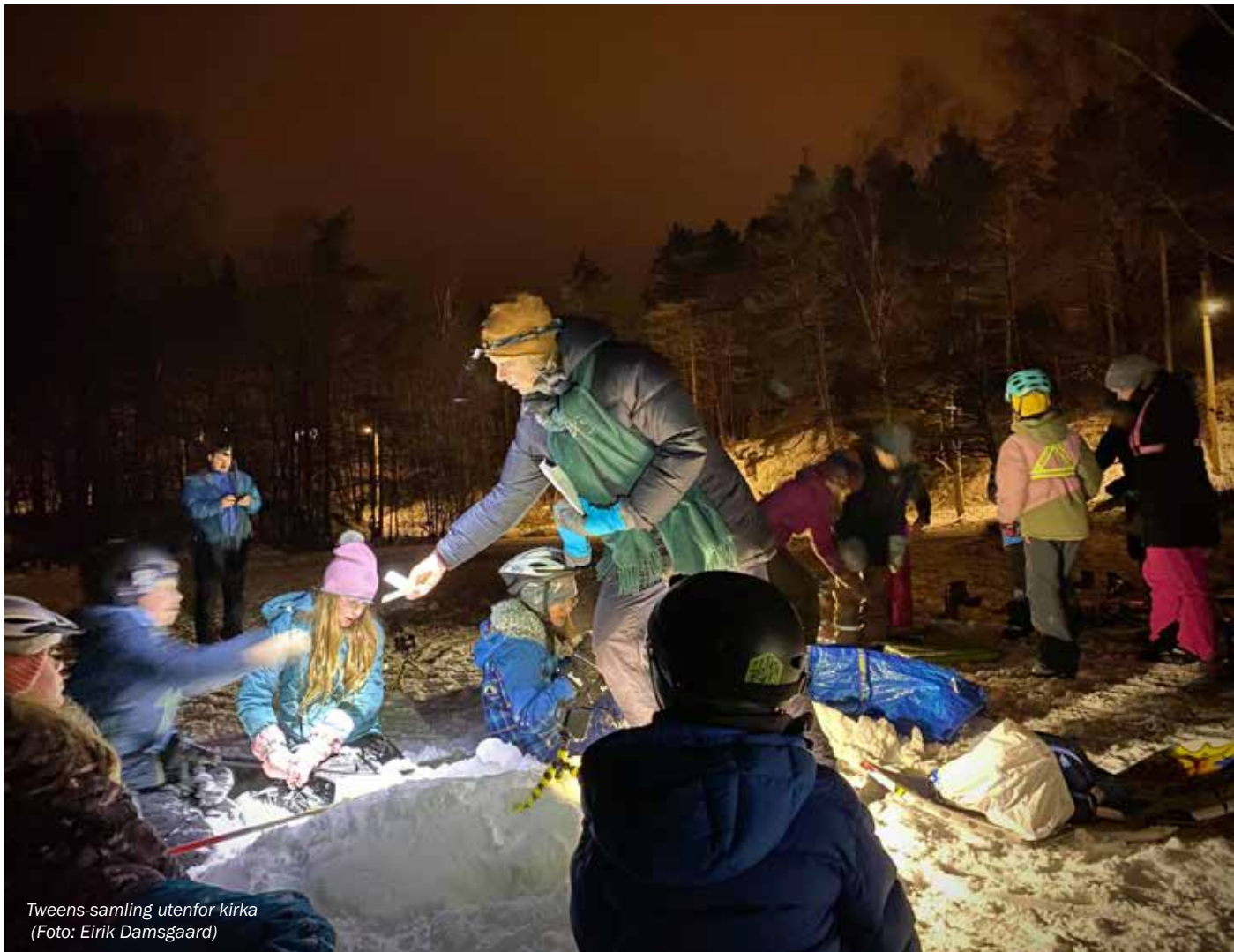
Tweens-samling utenfor kirka